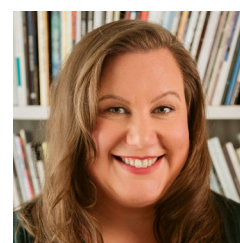
Emmi Jäkkö Lukukeskus, Finlandia