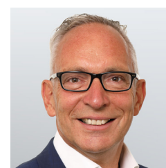
dr Jörg Maas Stiftung Lesen, Niemcy